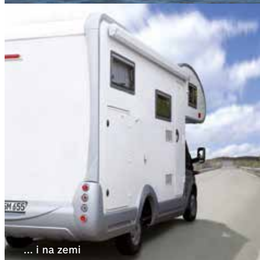
... i na zemi