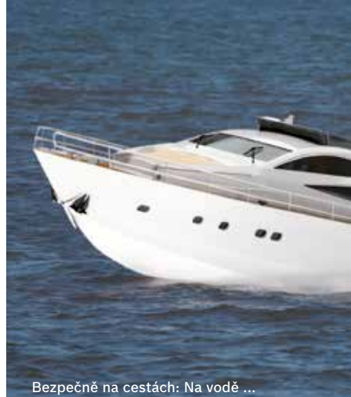
Bezpečně na cestách: Na vodě ...

Tipy pro akumulátory: Jednoduše, bezpečně a rychle lze nabíjet všechny olověné akumulátory s nejnovějšími nabíječkami akumulátorů C3 a C7 společnosti Bosch. Přirozeně také akumulátory s technologií AGM!