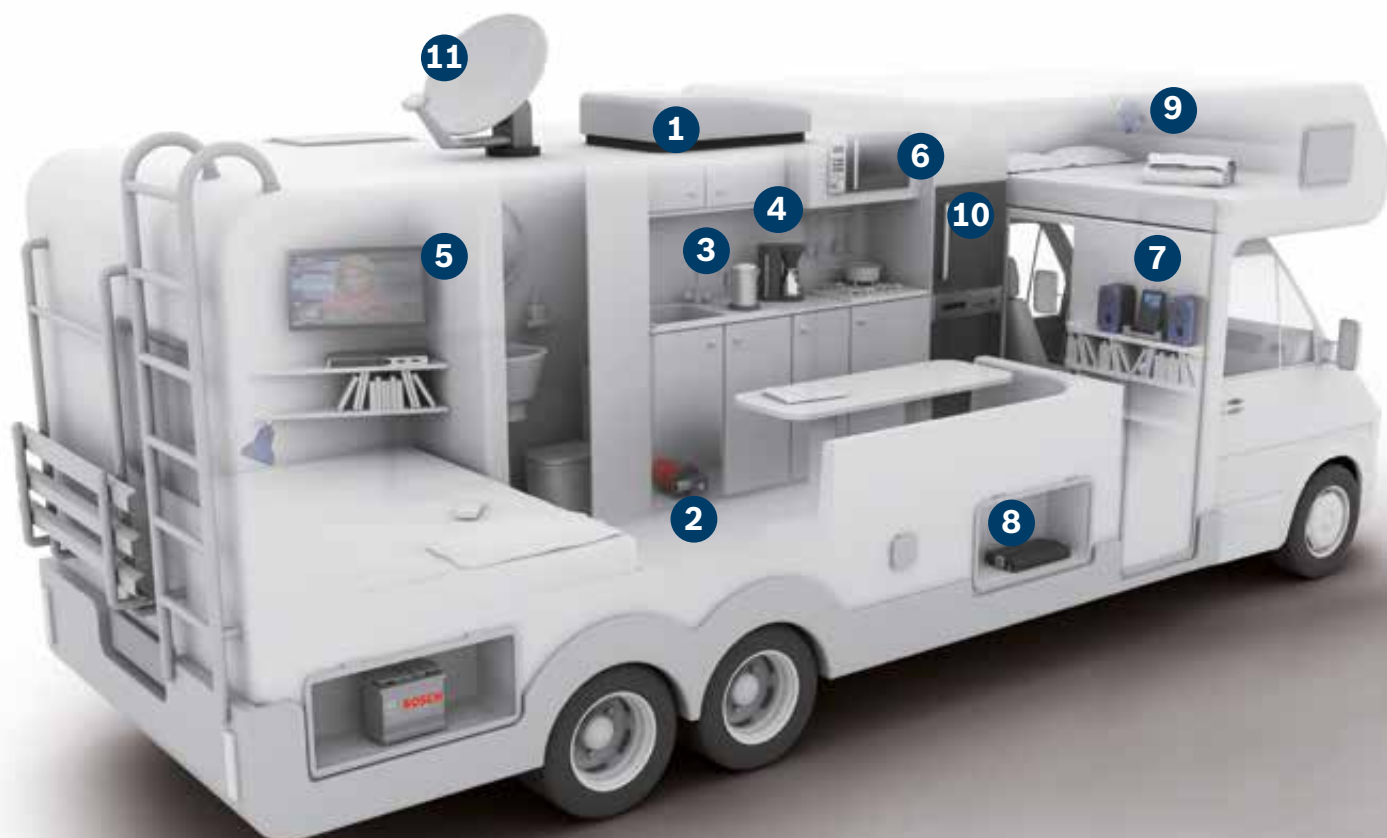
Model obytného vozu v řezu