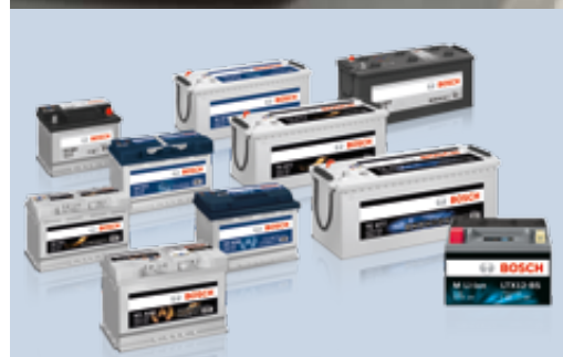
Program akumulátorů Bosch